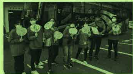
(子どもキャンプにて)