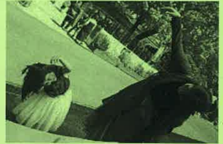
「お気に入りの木のポーズ」

玉縄地区では、4月16日に日比谷花壇大船フラワーセンターにて、植物を通して自然とのつながりを感じてもらおうイベント「ネイチャーゲーム」が開催されました。カードに記載されたミッションを行ったら、受付に戻って「一番お気に入りの木のポーズ」をしてもらいました。子どもたちには「木」の表情もわかるようでした。