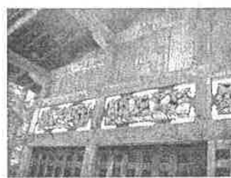
(左) 竜頭の滝 (中) アイスを食べた 光徳牧場 (右) 三猿