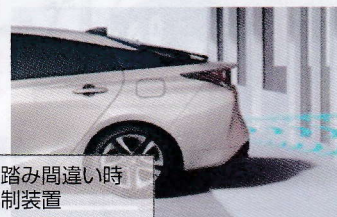
ペダル踏み間違い時 加速抑制装置

お持ちの運転免許にサポートカー限定条件を付与すると、運転できる対象車両を安全運転サポートカー（サポカー）に限定することができます。 試験等はありません。普通免許をお持ちの方であればどなたでも条件の付与が可能です。