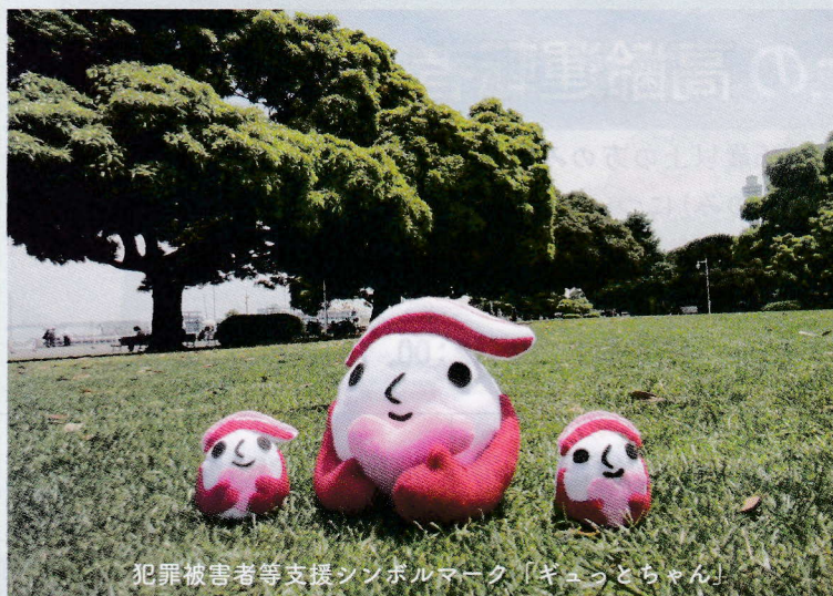
犯罪被害者等支援シンボルマーク「ギョットちゃん」

かながわ犯罪被害者サポートステーションは、神奈川県・県警察・認定特定非営利活動法人神奈川被害者支援センターの三者が一体となって、法律相談やカウンセリング等の総合的な支援を行っています。