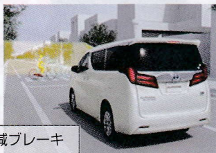
衝突被害軽減ブレーキ