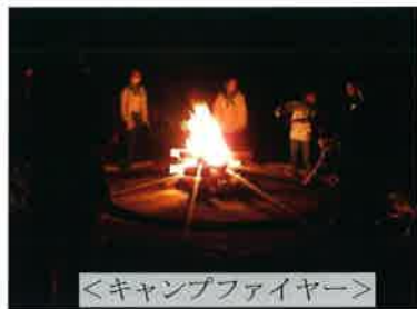
<キャンプファイヤー>

10月21日・22日県立愛川ふれあいの村にて鎌倉市青少年指導員連絡協議会主催、毎年恒例の「子どもキャンプ」が開催され総勢88名が参加。野外炊事、キャンプファイヤー、ディスクゴルフ等、楽しい2日間を過ごすことができました。