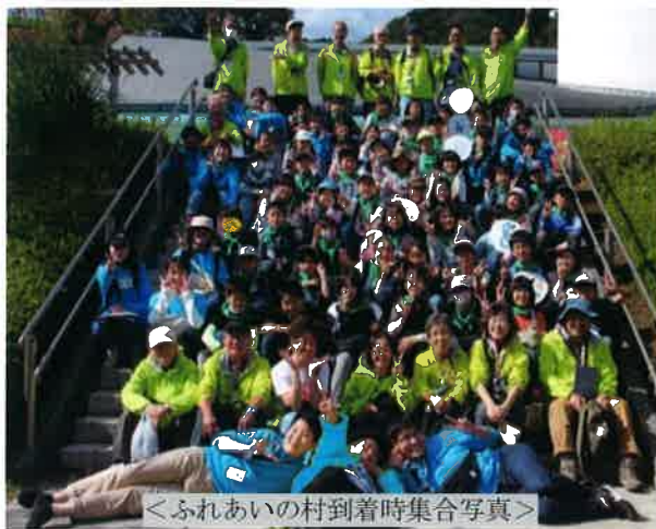
<ふれあいの村到着時集合写真>

10月21日・22日県立愛川ふれあいの村にて鎌倉市青少年指導員連絡協議会主催、毎年恒例の「子どもキャンプ」が開催され総勢88名が参加。野外炊事、キャンプファイヤー、ディスクゴルフ等、楽しい2日間を過ごすことができました。