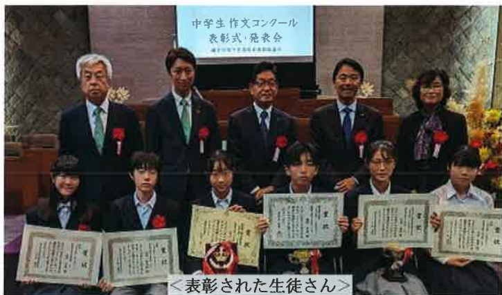
<表彰された生徒さん>