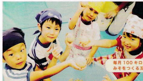
毎月100キロのみそをつくる五歳園児