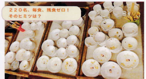
220名、毎食、残食ゼロ！そのヒミツは？