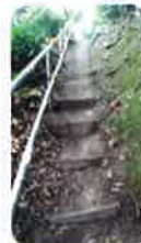
たぶのき公園裏山 津波避難路その2