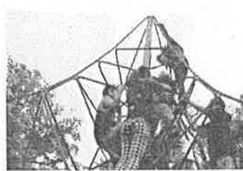
1・6年遠足で 1年生と遊ぶ6年生