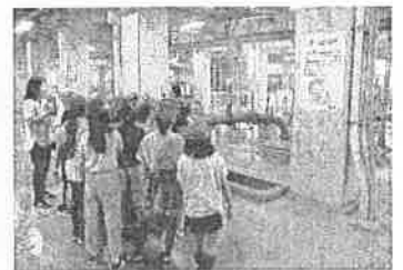
4年生 山崎浄化センター見学