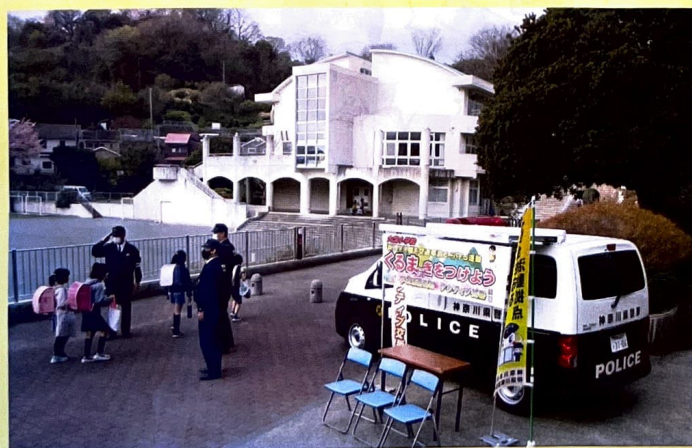
○児童の見守り活動

交番統合後の治安対策として、交番機能とパトカーの機動力を兼ね備えた「アクティブ交番」を32台導入（令和7年4月1日現在）し、統合した地域の駅前、公園、商業施設等で、落とし物や事件・事故等の受理、警察相談への対応、児童の見守り活動などを行っているほか、機動力を発揮してのパトロールも実施しています。