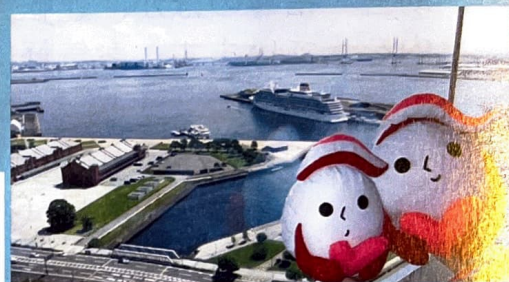
犯罪被害者等支援シンボルマーク 「ギュっとちゃん」