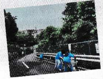
6/16鎌倉白山坂自治会清掃