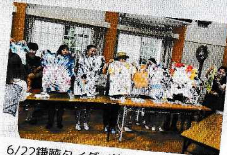
6/22鎌聴タイダイ染めワークショップ