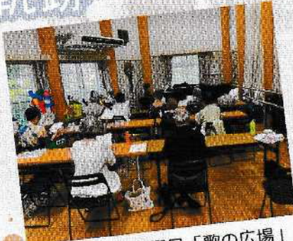
毎月第2第4水曜日「歌の広場」